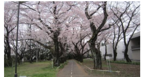
(平成28年撮影：山本 岩男)