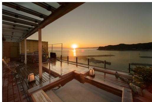
(写真) 吉夢・屋上露天風呂からの夕日

バス、ホテルの予約などの都合上、参加ご希望者は3月末日までに下記世話人又は旅行会幹事までご連絡いただきますよう、お願いいたします。