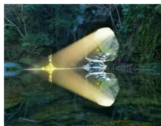
(写真) のうみぞ 濃溝の滝