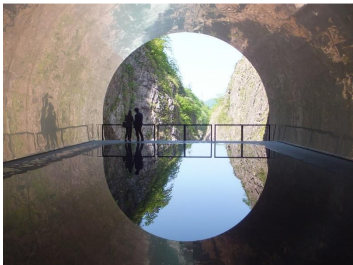
5-2. 清津峡：トンネル途中の見晴台から溪谷美を堪能