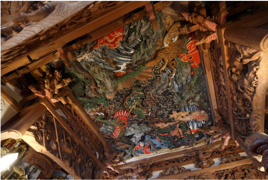
2. 西福寺開山堂：幕末の名匠石川雲蝶 うんちょう の見事な天井彫刻