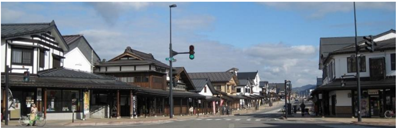
3. 塩沢宿牧之通り ぼくし ：「雪国の歴史と文化を活かすまちづくり」として数々の景観大賞を受けた美しい街並