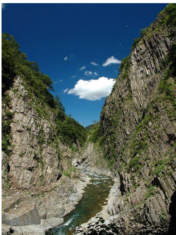
5-1. 新緑映える柱状節理の清津峡