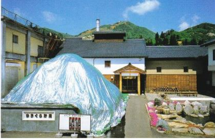
1. ゆきくら（雪中貯蔵庫）：特殊なシートで天然の雪を覆い年間を通して大吟醸を低温で貯蔵