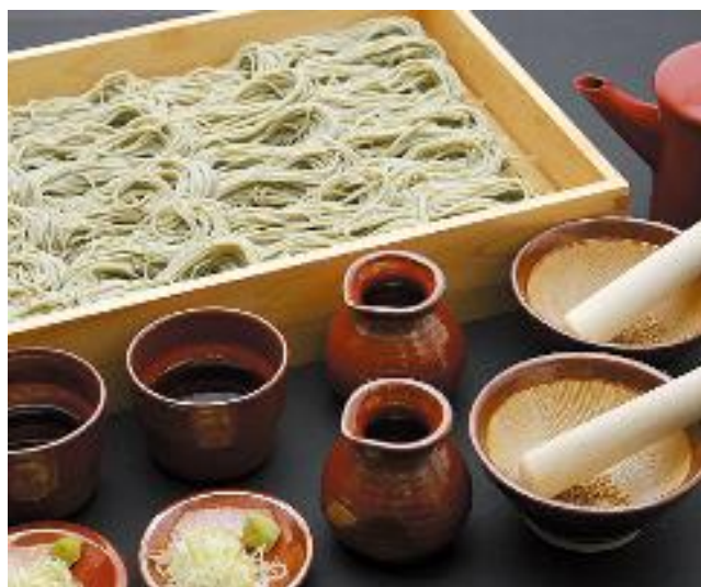
6. 「ふのり」をつなぎに使った越後名物の「へぎそば」。歯ごたえとのおごしが人気。(2日目昼食に予定)