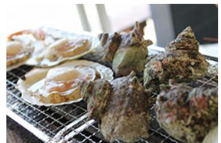
2日目昼食は海鮮浜焼き食べ放題