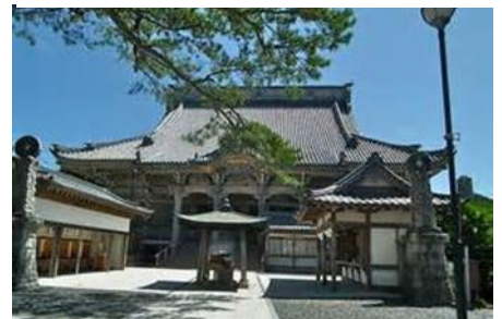
ホテル「吉夢」に隣接する日蓮宗「誕生寺」