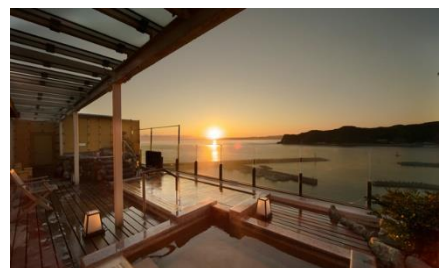
日本の夕陽百景に選ばれた鯛の浦を望むホテル「吉夢」天空庭園風呂