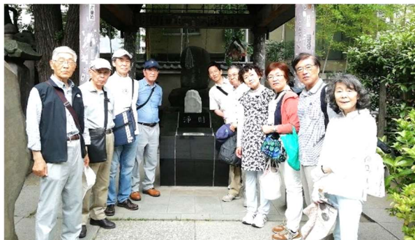
(記: 町田 和夫)

参加者 10名: 青山、市川(彰)夫人、大内、木野、坂本、當麻、富澤夫妻、藤井、町田(和)