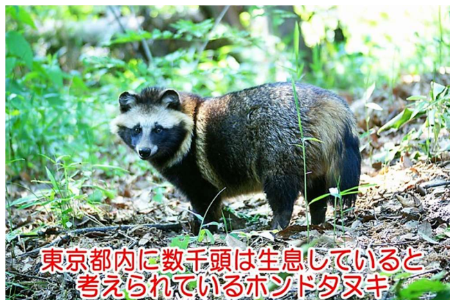
東京都内に数千頭は生息していると 考えられているホンダタヌキ

東村山にも多くの野生動物たちが棲息しています。いずれ機会がありましたら、皆さまにもそういったお話ができると良いな、などと考えている次第です。今後ともよろしく願い申し上げます。