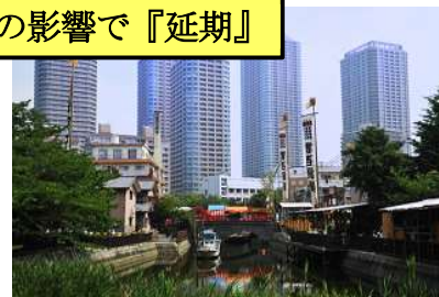
佃島のリバーシティ 2 1

佃島・月島は江戸時代から長い時間をかけて埋め立てられ、発展拡大してきた地域です。最近ではタワーマンションが林立する景色の中に、昔懐かしい下町の風情が残り新旧が混在する街です。近くには新橋、銀座といった商業地域がありますが古き良き東京を知ることができます。東京都のウォーターフロント開発を象徴する場所ですが、佃煮が生まれた佃島には今も多く佃煮の老舗が残っています。