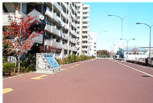
東山道武蔵国分寺跡