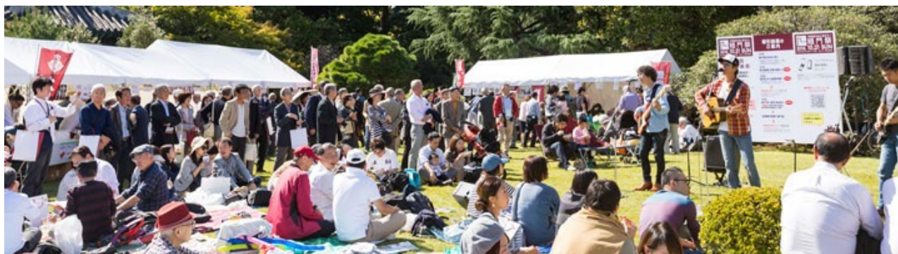
2019 年イベント（大隈庭園）