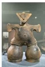
とがりいし 尖石縄文考古館・国宝土偶