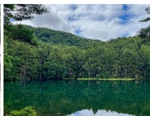
みしゃかいけ 御射鹿池