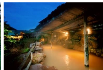
よこや 横谷温泉旅館・巨石露天風呂